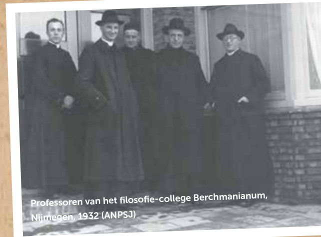
Professoren van het filosofie-college Berchmanium, Nijmegen, 1932

1896: geboren op 18 januari in Maastricht als telg van de welgestelde industriële en politiek actieve familie Regout 1913: studie rechten in Utrecht (kandidaats) 1915: treedt in als jezuïet in noviciaatshuis Mariëndaal te Grave 1917: studie filosofie bij de Orde van Oudenbosch 1920: studie rechten in Leiden 1924: studie theologie aan theologiecollege Canisarius in Maastricht 1928: vormingsjaar in Wales 1929: docent staatsinstellingen op het Canisius College, Nijmegen 1932: docent sociologie op filosofiecollege Berchmanium, Nijmegen 1934: verdediging proefschrift in Leiden (cum laude) 1937: studentenmoderator aan de Katholieke Universiteit Nijmegen 1939: benoemd tot buitengewoon hoogleraar volkenrecht in Nijmegen 1940: inaugurele rede 1940: gearresteerd door de Gestapo 1942: van uitputting gestorven in concentratiekamp Dachau, 46 jaar oud